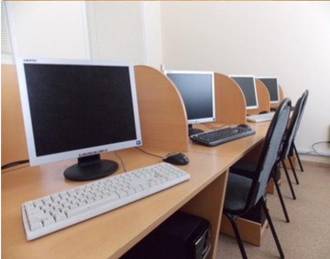
Рис. 1.32 Аудитории и лаборатории (Болдина, д.98б)