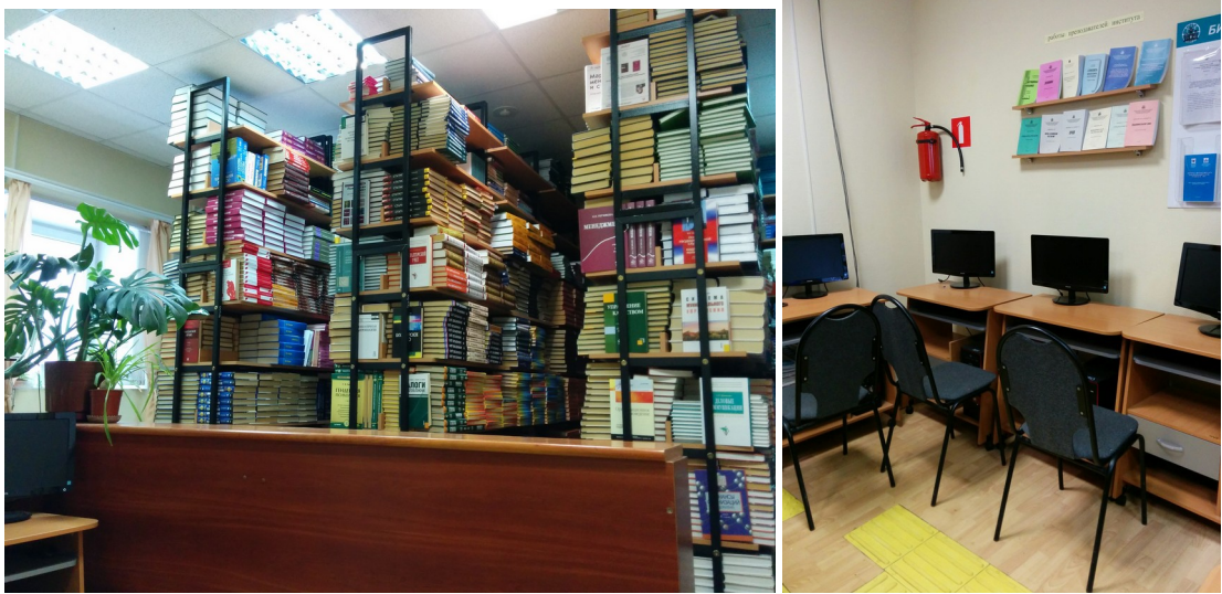
Рис. 1.29 Библиотека (Болдина, д. 98б)