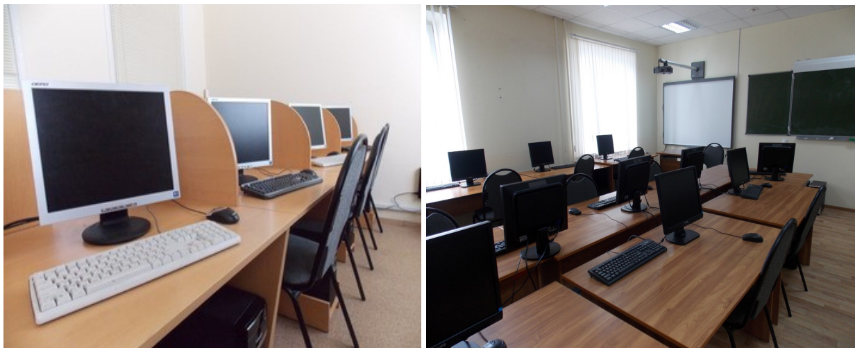
Рис. 1.26 Компьютерные классы (Болдина, д.98б)

Все учебные помещения (аудитории, лаборатории, кабинеты, компьютерные классы) имеют паспорта кабинетов, оборудованы пожарной сигнализацией, соответствуют санитарно-эпидемиологическим требованиям и требованиям пожарной безопасности.