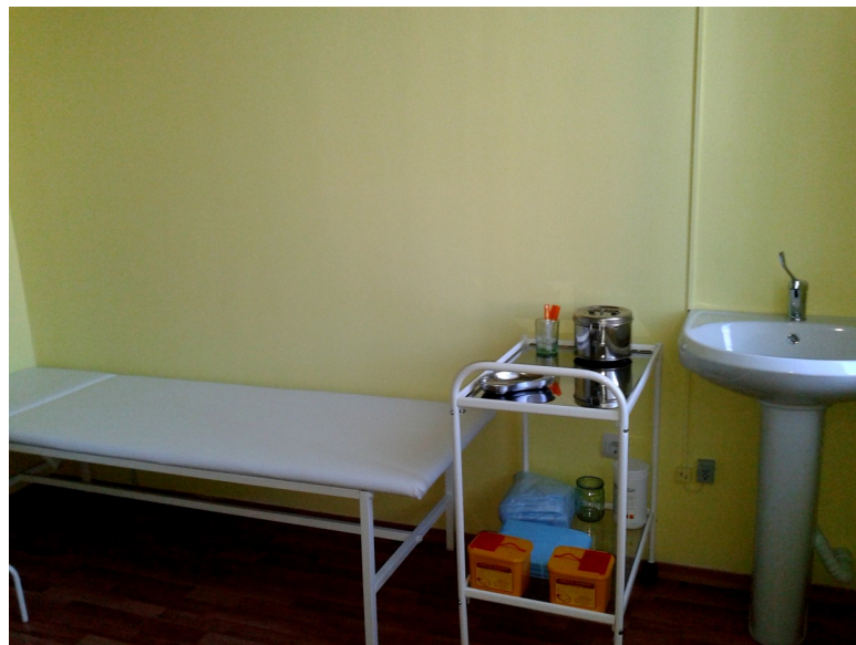
Рис. 1.28 Медицинский кабинет (Болдина, д.986)