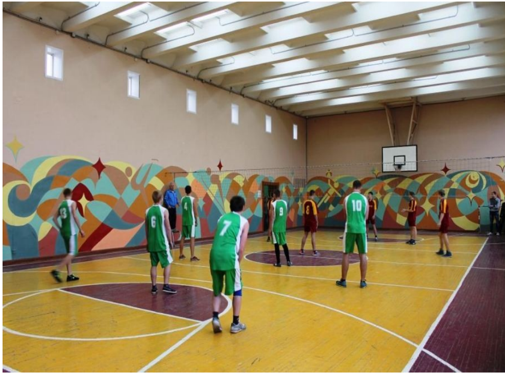
Рис. 1.31 Спортивный зал (ул. Рязанская, д.40)