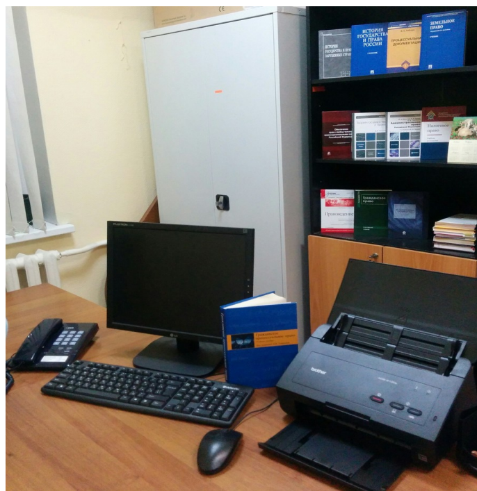
Рис. 1.30 Специализированная библиотека с техническими возможностями перевода основных библиотечных фондов в электронную форму (Болдина, д. 98б)