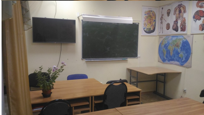
Рис. 1.33 Аудитории и лаборатории (Болдина, д.98б)