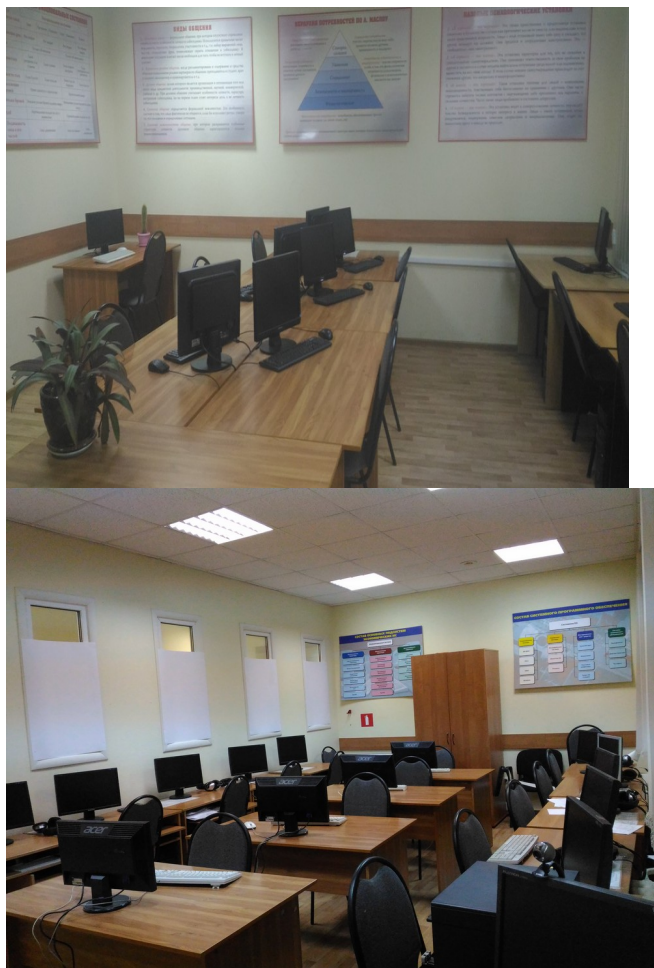
Рис. 1.27 Компьютерные классы (Болдина, д.98б)